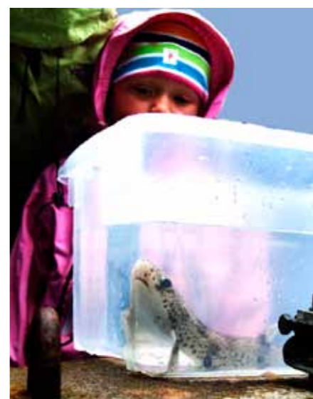
Barnen tyckte det var spännande att så nära kunna studera hajen Grälle.

Det gör vi för att detta är en av Öresunds barnkammare. Här växer flertalet av våra 75 fiskearter upp. Havsbotten är spännande, först sandrev 10 meter ner till reven på 20 meter, för att sen nå ett djup på 45 meter.