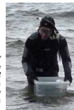
"Sjösättningen" av hajen Grälle följdes med spänning från stranden av alla barn och vuxna.

Öresund består till stor del av mjukbotten, medan det ofta grundare och därmed hårt strömmande vattnet utanför Domsten och Gräläge mestadels glider fram över en fast botten av moränlera och lermorän. Säkert har trålningsförbudet i Öresund från 1932 betytt mycket för Grollegrundets stora artrikedom.