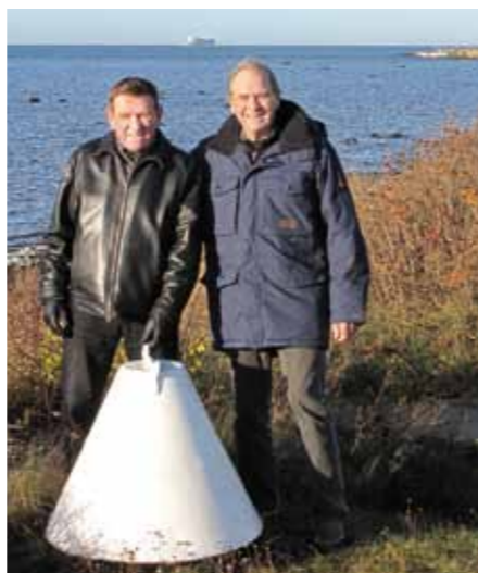
Ungefär där båten i bakgrunden stävar mot norr, kunde man se ubåtshindret.