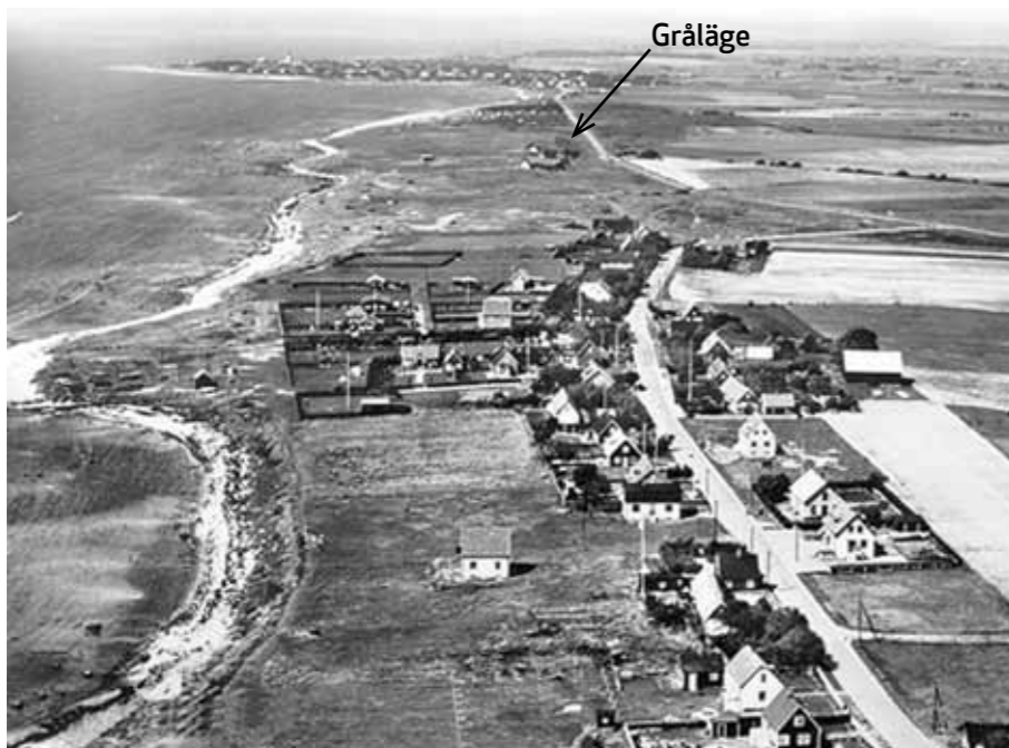
Flygfotot från 1944 visar det ännu skogfria dynlandskapet mellan Domsten och Gråläge. Tallskogen planterades först efter andra världskriget.

Oscar II:s pojkar skickades en efter en på golfkurs till London för att kunna föra sig i