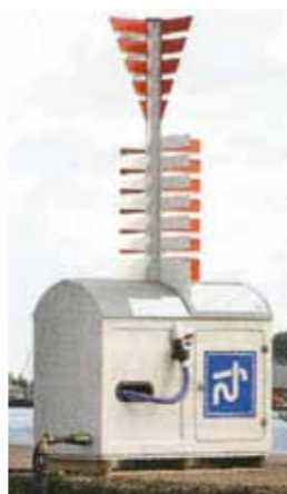
Exempel på en sugtömningstation, som gör det möjligt att pumpa över toalettavfall från båtarnas septitankar.