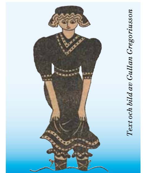
Text och bild av Gullan Gregoriusson